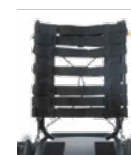
Rücken: ARH 2179