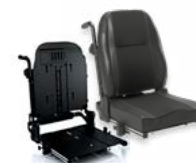
Rücken: ARH 2172 bzw. 2173