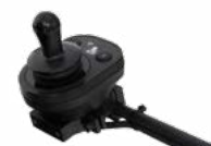
2231 / 2232