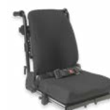
Rücken: ARH 2174, 2175