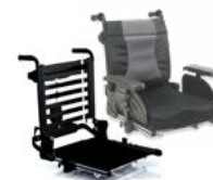
Rücken: ARH 2171